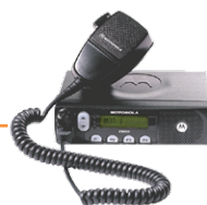
Rádio base analógico ou digital