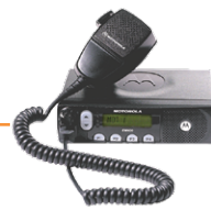
Radio base analógico o digital